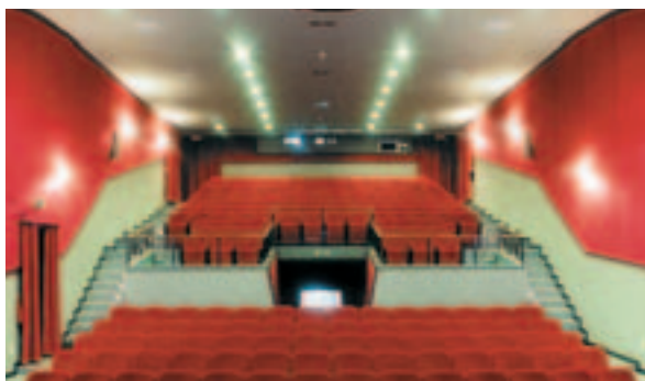
Diverse attività vengono ospitate dalla Sala della Comunità.

di famiglia, inteso come facilità di relazioni fra alunni, genitori, docenti, collaboratori che portano a far prevalere i rapporti umani sulla burocrazia. La vicinanza alla Sala della Comunità ci aiuta a sperimentare questo spirito di famiglia, i bambini la riconoscono come qualcosa di