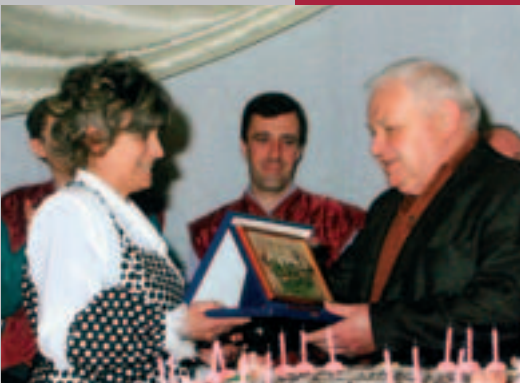
...abbiamo voluto premiare proprio gli spettatori, consegnando una targa ai "fedelissimi", cioè coloro che fin dalla prima edizione hanno immancabilmente sottoscritto l'abbonamento.

Per quanto riguarda la dotazione tecnica, si sta valutando la possibilità di accedere a un nuovo servizio, la trasmissione dei film in formato digitale, per la quale il nostro proiettore è già predisposto. Con questo sistema, in pratica, non sarà più necessario avere la pellicola, quindi si potranno proiettare anche film in prima visione. Infine, qualche anticipazione per il 2007: l'anno prossimo ricorrerà infatti un anniversario molto importante, la nostra Sala della Comunità compirà addirittura il mezzo secolo di vita! Stiamo già pensando a qualche gustosa iniziativa. Intanto lanciamo un appello a chi possiede materiale, soprattutto fotografie, sulla storia della Sala perché si mettano in contatto con noi: abbiamo bisogno della collaborazione di tutti per festeggiare in modo adeguato questo traguardo.