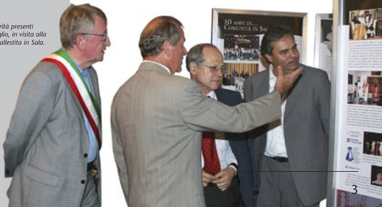
Le Autorità presenti il 21 luglio, in visita alla mostra allestita in Sala.

E tanta, tanta gente che con noi condivide la gioia della condivisione di una struttura a cui auguriamo di festeggiare ancora tanti anniversari.